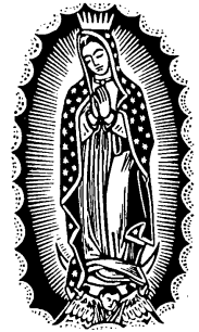
- 평화신문 -

찬란한 성모님의 계절 오월에 아픔도 슬픔도 그 무엇도 당신을 향한 기쁨으로 받아들이게 해주소서.